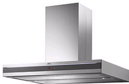
JFA 9673 X

Reinigungsfreundliche Insel-Dunstabzugshaube (100 cm Breite) in Edelstahl mit außergewöhnlichem LED Leuchtstreifen auf beiden Längsseiten