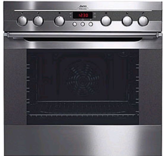
JON 63140 X

Reinigungsfreundlicher Einbau-Herd mit 9 Backofenfunktionen und Thermotimer. Antifinger-Edelstahl-Beschichtung. Im modernen Global Design mit LED-Leuchtstreifen und versenkbaren Bedienelementen.